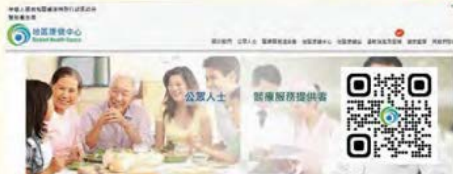
地區康健中心網頁

地區康健中心是政府倡導的嶄新基層醫療服務，以公私合營、醫社合作及地區為本為原則，成為地區醫療服務及資源分配的樞紐。隨着一間又一間地區康健中心投入服務，大家都關注地區康健服務如何幫助市民建立更健康的生活模式，同時亦希望能紓緩公共醫療系統的壓力。