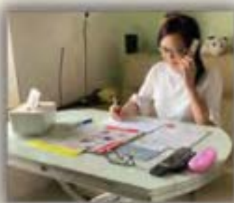
義工進行電話慰問

透過義工的上門探訪及電話跟進，為長者提供關懷、支援、教導自我管理慢性病的知識及技巧，鼓勵他們培養良好的飲食及運動習慣，以正面態度面對病患，控制及減慢病情轉差的速度，減低疾病帶來的痛苦。計劃包括不同津貼的服務和活動，如物理治療服務(可按需要進行轉介)，增加長者對社區及病人資源組織的認識，增強支援網絡，提倡社區關懷及互助精神。