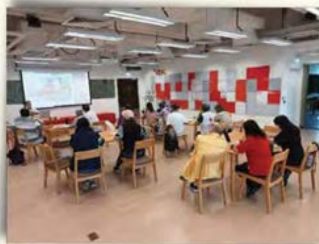
義工/啟導義工培訓課程