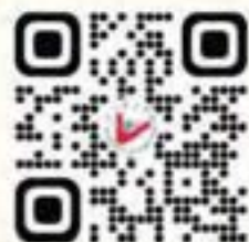
香港糖尿聯會網站